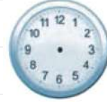
الْخَامِسَةُ وَ الرَّبِيعُ