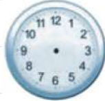
الثَّامِنَةُ وَ النُّصْفُ